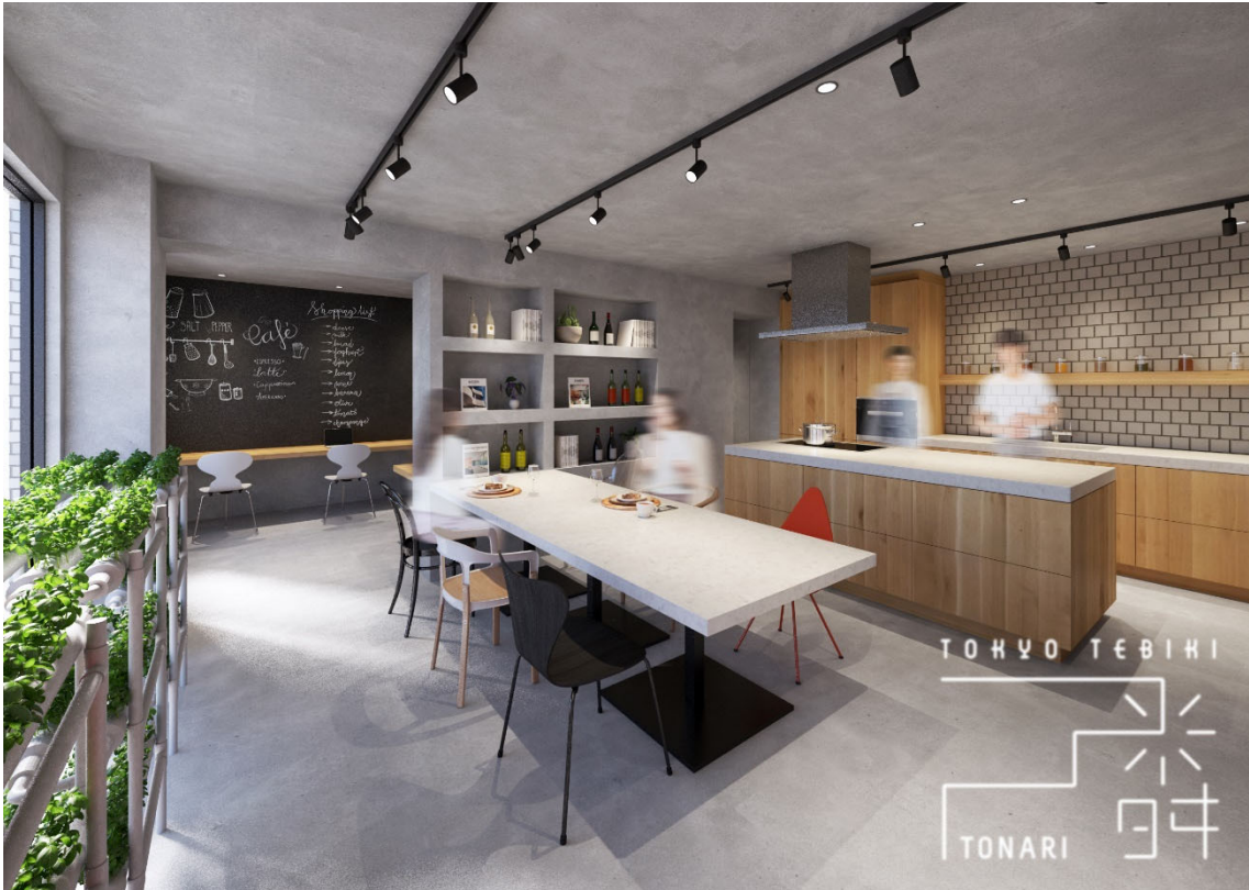
「東京 tebiki 隣」イメージ図

「東京 tebiki 隣」はシェアキッチンのほか、スタジオキッチン、コワーキングスペース等を兼ね備えた地上 3 階建ての飲食業特化型インキュベーションラボ施設です。「東京 tebiki 隣」の名称は、隣接する複合施設「東京 tebiki」の隣に位置することから命名しました。