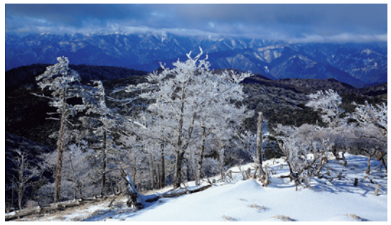
冬は空気が澄んでいるので天気が良ければ遠方まで一望