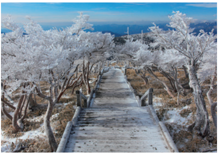
霧氷も楽しめます(2月のイメージ)