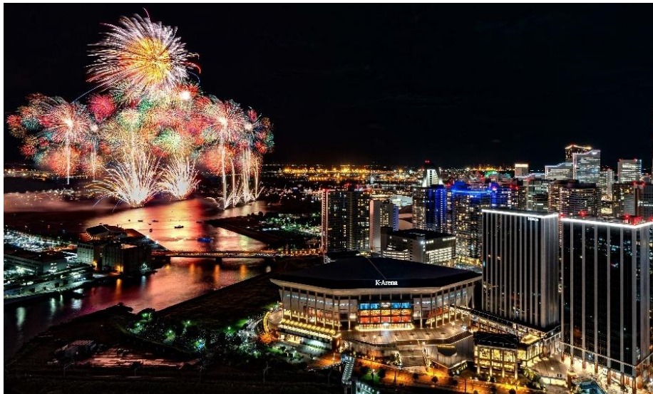
ミュージックテラス（夜景）

Pollstar（ポールスター）は、米国および国際的なコンサート・ライブミュージック業界の業界紙で、コンサートプロモーター、ブッキングエージェント、アーティスト関係者、施設経営者、その他ライブエンタテインメントビジネスに関わる業界団体向けに週刊誌の発行（定期購読者数1万人超）および、ウェブサイトでの情報提供（SNSの総フォロワー数約8万人）をしている媒体となります。