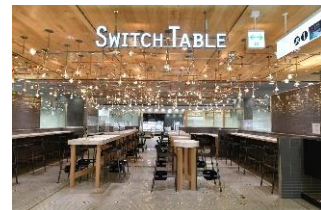
「スイッチテーブル」