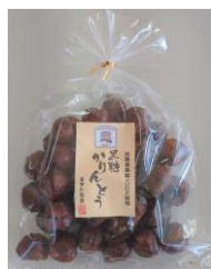
<黒糖かりんとう> 沖縄産黒糖 100%使用