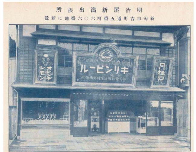
開設当時の明治屋店舗：明治屋広報誌「嗜好」（大正15年8月15日発行）に掲載「キリンビール」の看板の下部に「株式会社明治屋新潟出張所」の文字が書かれています。

明治屋が新潟に初めて出店したのは1926（大正15）年8月のこと。新潟市古町通五番町に明治屋新潟出張所を開設しキリンビール他の卸売販売を開始、同時に小売店舗を開設したのが新潟における明治屋ストアーの原点です。