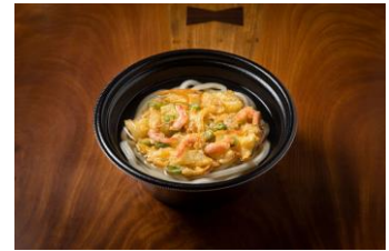
＜讃岐海老天ぷらうどん＞