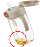
手前にくるストロー