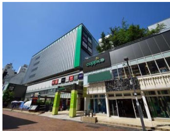
[コピス吉祥寺外観]