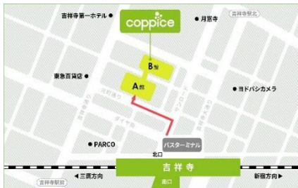
[コピス吉祥寺アクセス MAP]