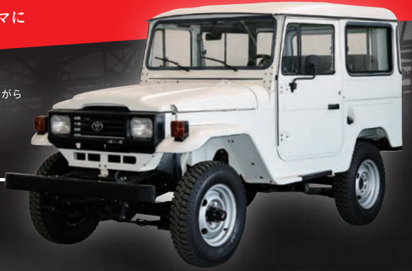
トヨタ アイゴ (2006・チェコ)