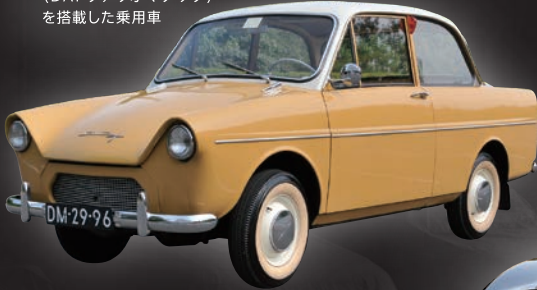
DAF 600 (1959・オランダ)