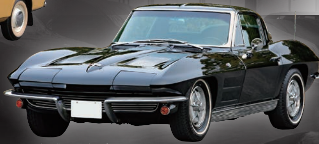
ロータス エラン S4 (1972・イギリス)