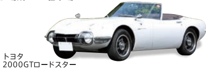
トヨタ 2000GTロードスター