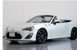
トヨタ FT-86 Open Concept