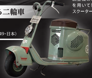
ホンダ スーパーカブ CA100型 (1962・日本)