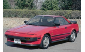
トヨタ MR2 AW11