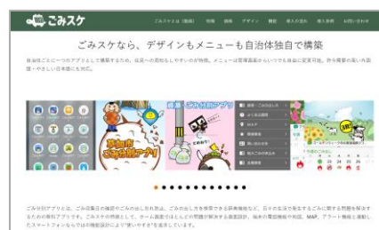
「ごみスケ」トップページ

G-Placeが提供する地域の課題解決・活性化につながる自治体向け製品の検索サイト。