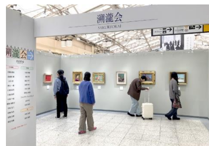
※2022 年開催時の「溯瀧会」