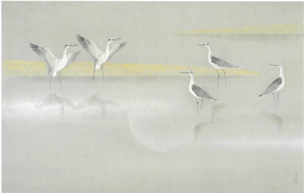
「月の水辺」平成2年(1990) 大分市美術館蔵

東洋の感性の減退や現代の日本画について、真摯に警告を発し、さまざまな鳥の姿を通じて、自然の叡智を示し、未来へのメッセージを送り続ける上村淳之の姿を紹介します。