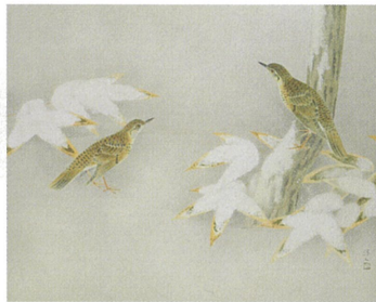
「雪(鶇)」昭和53年(1978) 株式会社ヤマタネ蔵