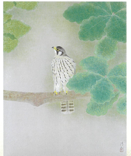
「幼雀」平成5年(1993) 岐阜プラスチック工業株式会社蔵