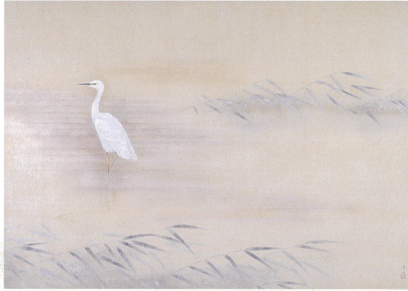
「風渡る」平成4年(1992) 大分市美術館蔵