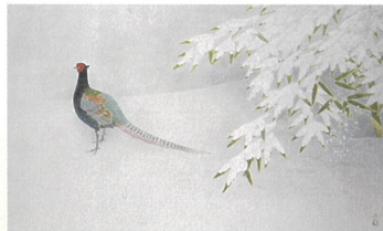
「雪野」平成3年(1991) 岐阜プラスチック工業株式会社蔵