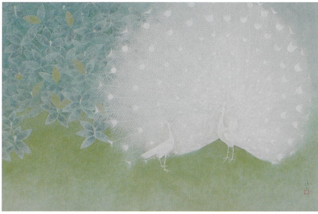
「春庭(白孔雀)」平成7~11年頃(1995~99) 京都花鳥館蔵