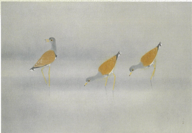
「農」昭和49年(1974) 株式会社ヤマタネ蔵