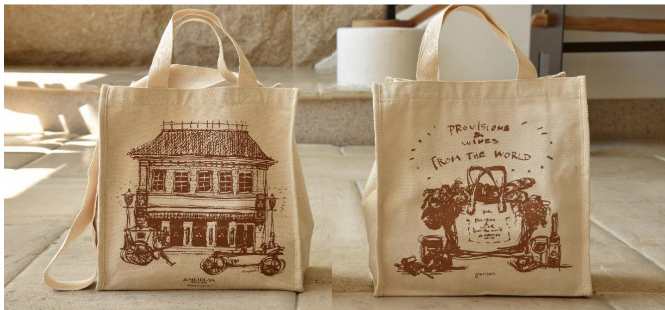
キャンバス 2Way バッグ 明治屋社屋モチーフの表面（左）、アマーノモチーフの裏面（右）

明治18年に横浜で創業した明治屋は、ジャム等の自社ブランド品やウイスキー、パスタ等の直輸入品をはじめ、上質な品々を国内のみならず世界中から取り揃えています。創業以来、時代の変化に応じながらお客様の期待以上の商品・サービスの提供を常に目指してきました。明治屋の経営理念「いつも いちばん いいものを」。その思いが genten のものづくりと通じるところがあり、お客様に長く使っていただける上質なお買い物バッグを目指して、今回のコラボレーションが実現しました。