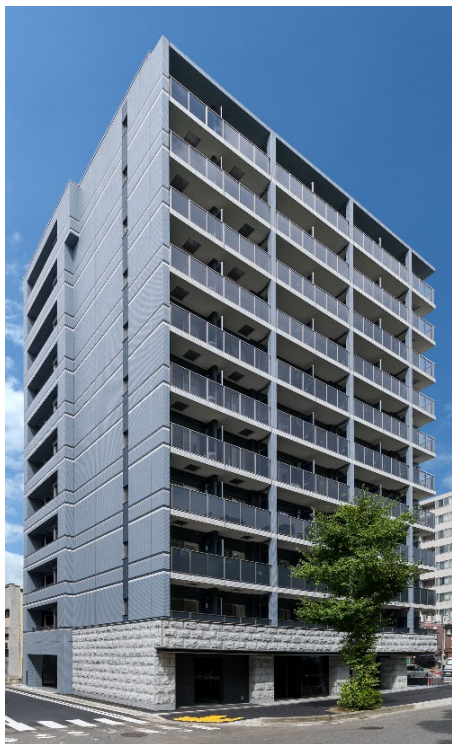
【ガーラ・ステーション横濱大通り公園】