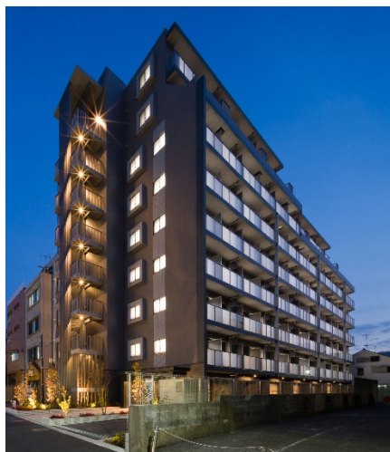
【ガーラ・グランディ大森西】