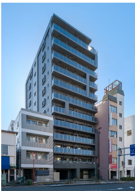
【ガーラ・グランディ深川住吉】