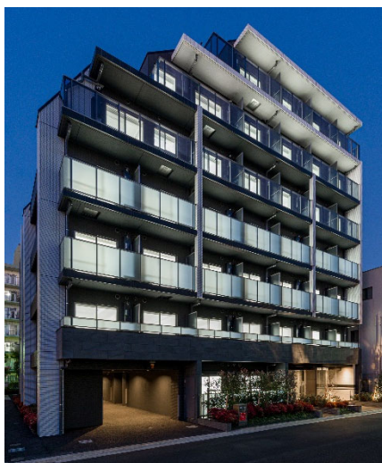
【ガーラ・プレシャス横浜鶴見】