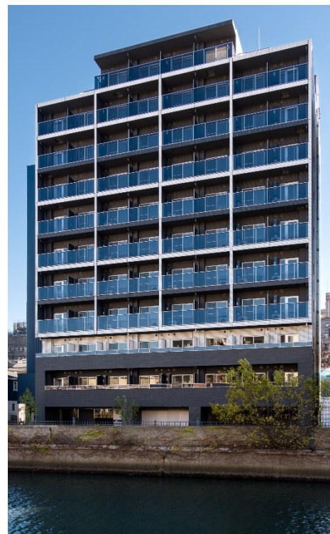
【ガーラ・リバースクエア横濱南】