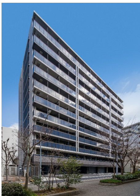
【ガーラ・プライム横濱関内】

当社グループは、今後も上質なデザインを追求した外観やエントランス、安全性・快適性を重視した設備仕様など、居住者目線に立ったマンションの企画・開発を進めてまいります。