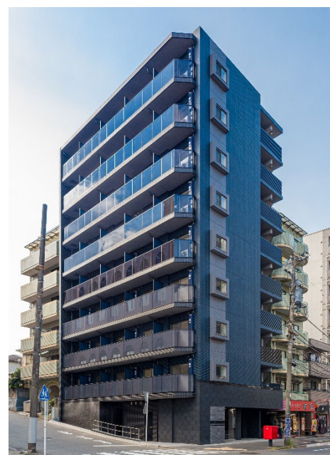
【ガーラ・シティ横浜反町】