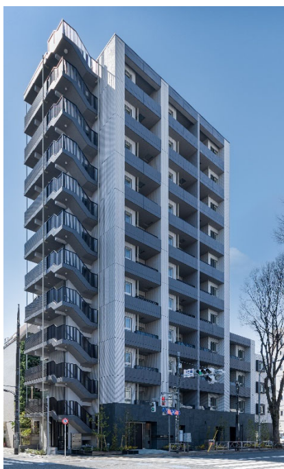
【ガーラ・アヴェニュー調布】