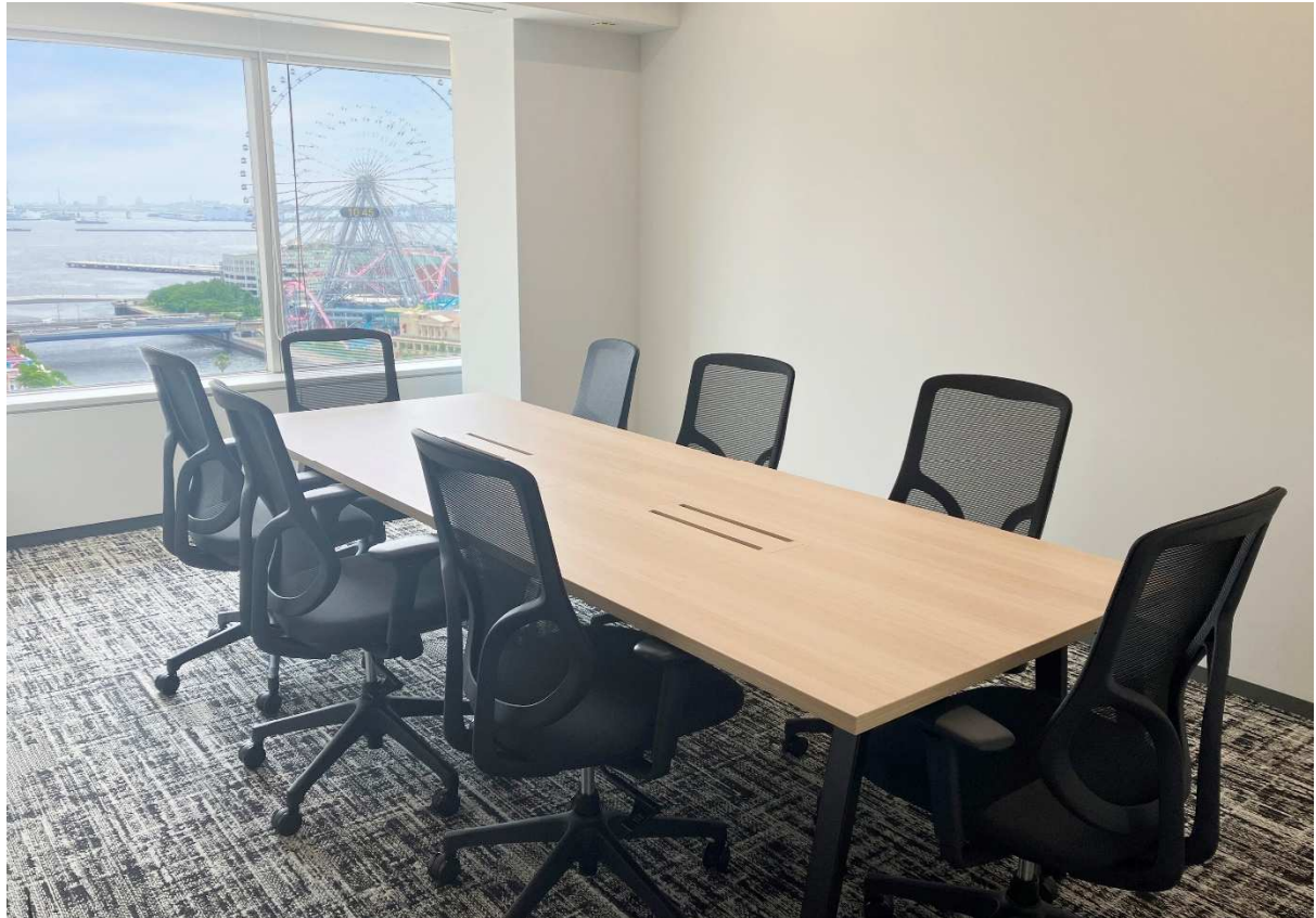
横浜の港を一望できる会議室