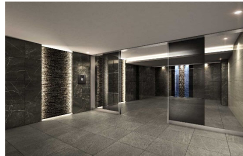
【エントランスホールイメージ】