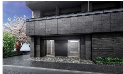
【エントランスイメージ】