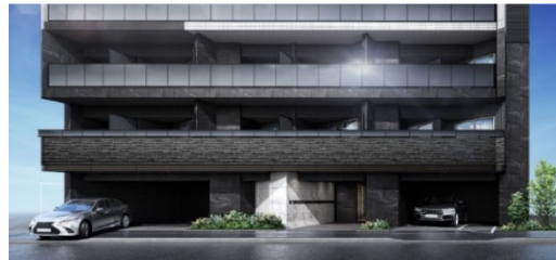
【エントランスイメージ】