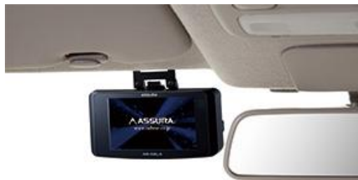
車内ルーフ付近 ※オプションの宙吊りステー（R0-118）が必要です