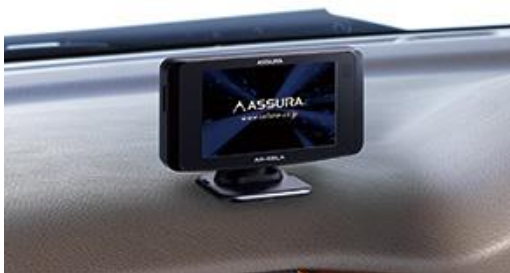
ダッシュボード（マウントベース使用）