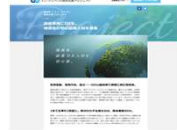
特設ページでの告知