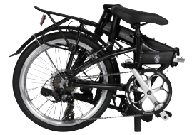
折りたたみイメージ