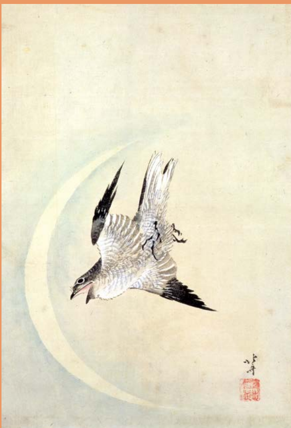
左上:「鶯翠雀 虎耳草 蛇莓」(前期)、右上:「文鳥 辛夷花」(作品を替えて通期展示)、右下:「鶯小菊」(後期)、 左下:「鶯 白粉花」(後期) 右:「杜鵑」(前期)

現在も鳥の愛好者は多いですが、北斎も鳥を描いた作品を多数手がけ、その優れた描写は錦絵に花鳥画のジャンルを確立させるのに一役買っています。本展では、北斎一門の描く様々な鳥や、鳥の意匠を展覧し、バードパークで色々な鳥たちとふれあうように、その美しさや画技の素晴らしさを身近に感じていただけます。さらに、鳥が舞台装置としての役割を果たしている点にも着目し、鳥によって表現された季節や場所、人物の思いなどを読みとくとともに、北斎が本物の鳥を制作の演出に使用した「竜田川に紅葉の図」のエピソードをご紹介します。 北斎の描いた鳥の翼にのって、当時の人々と鳥の織りなす世界をお楽しみください。