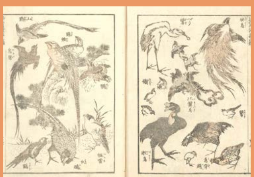
「北斎漫画」三編 風鳥 べら鷲 衡比翼鳥 鶯鳥 鴉鳥 鴨鳥 山鳥 鶯鳥 鳳 錦 雛 鶏 鵜 嘴 白 鶯 鶯 (通期) ※すべて葛飾北斎画、すみだ北斎美術館蔵

現在も鳥の愛好者は多いですが、北斎も鳥を描いた作品を多数手がけ、その優れた描写は錦絵に花鳥画のジャンルを確立させるのに一役買っています。本展では、北斎一門の描く様々な鳥や、鳥の意匠を展覧し、バードパークで色々な鳥たちとふれあうように、その美しさや画技の素晴らしさを身近に感じていただけます。さらに、鳥が舞台装置としての役割を果たしている点にも着目し、鳥によって表現された季節や場所、人物の思いなどを読みとくとともに、北斎が本物の鳥を制作の演出に使用した「竜田川に紅葉の図」のエピソードをご紹介します。 北斎の描いた鳥の翼にのって、当時の人々と鳥の織りなす世界をお楽しみください。