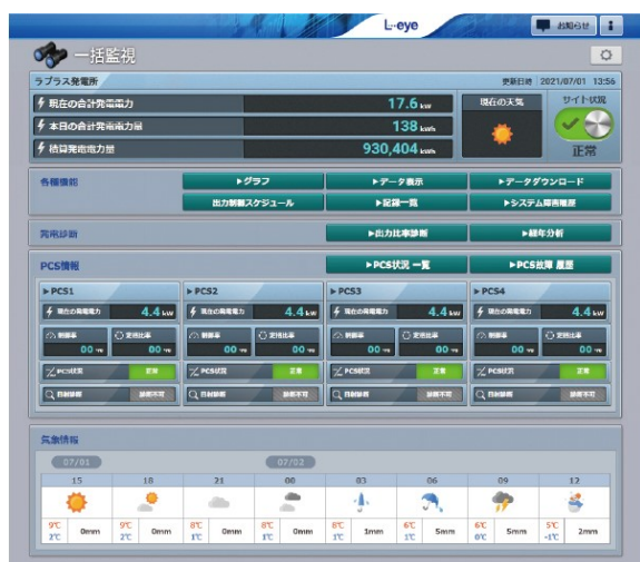
▲ L・eye 監視画面

遠隔監視システム&サービス L・eye は、PCS と直接通信することで発電電力量を高精度で取得し、高機能監視を実現。また、PCS ごとの故障や異常などの詳細情報も取得し、発電機会の損失を最小限に抑えます。PCS 対応メーカーは 70 社以上で業界トップクラス。さらに、出力制御にも追加機器不要で標準対応。発電システムの安定稼働を幅広く支えます。