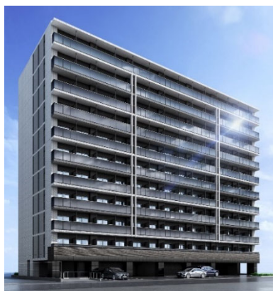
【南西側外観イメージ】

また、マンションの周辺では、日々のお買い物に便利な大型商業施設や「イセザキ・モール」をはじめとした商店街など、多彩な生活利便施設が充実。こだわりの美味に出逢える数々の名店など、訪れたいグルメスポットも豊富です。さらに、「大通り公園」や「横浜公園」といった寛ぎのスポットも身近に揃い、毎日 を便利に、快適に暮らせる環境が整っています。