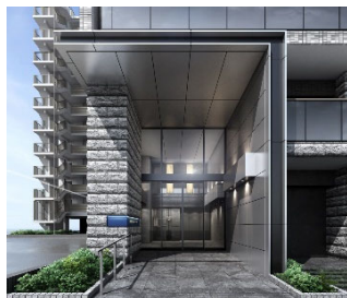
【エントランスイメージ】