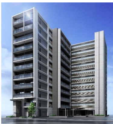
【北東側外観イメージ】