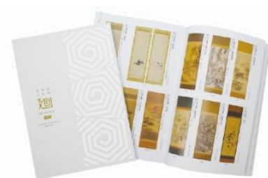
カタログイメージ