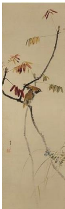
渡邊省亭「春秋花鳥雙幅」 《最低入札価格》 ¥680,000