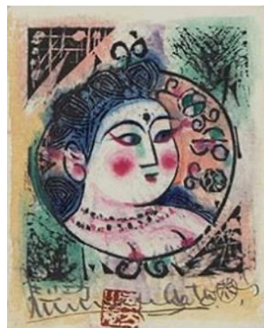
棟方志功「天平の柵」 《最低入札価格》 ¥5,000,000