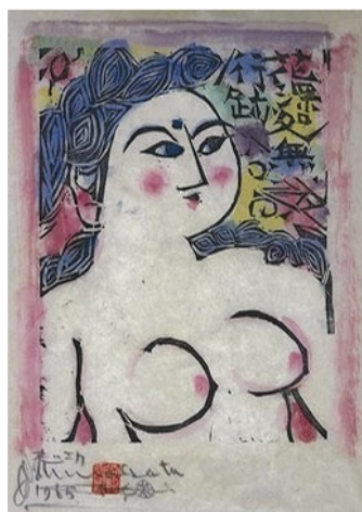
棟方志功「思瞳の柵」 《最低入札価格》 ¥3,800,000