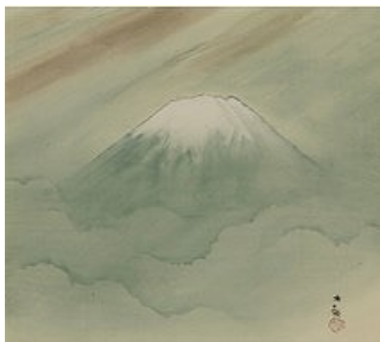
横山大観「霊峰富士」 《最低入札価格》 ¥7,000,000