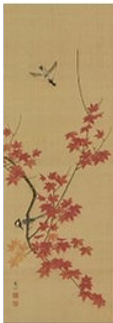
円山應挙「紅葉四十雀図」 《最低入札価格》 ¥800,000