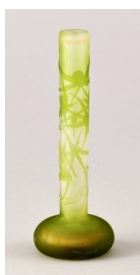
エミール・ガレ「花文花瓶」