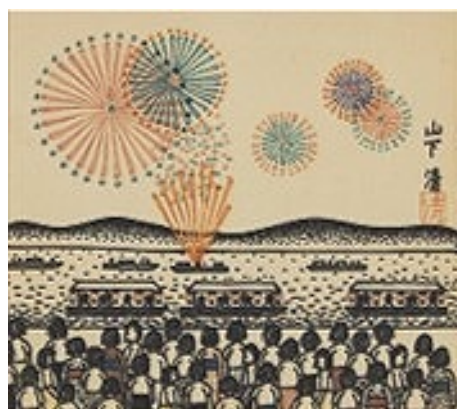
山下清「花火」 《最低入札価格》 ¥1,800,000