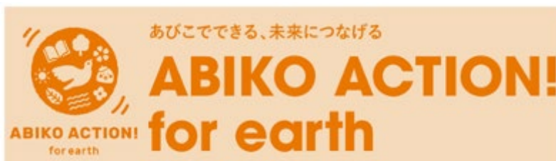
▲ABIKO ACTION! for earthロゴ

あびこショッピングプラザでは、「あびこでできる、未来につなげる ABIKO ACTION! for earth」という名称で我孫子市の文化や自然、暮らしに関すること等、施設を支えてくださる地域のお客様、店舗、団体・企業、行政