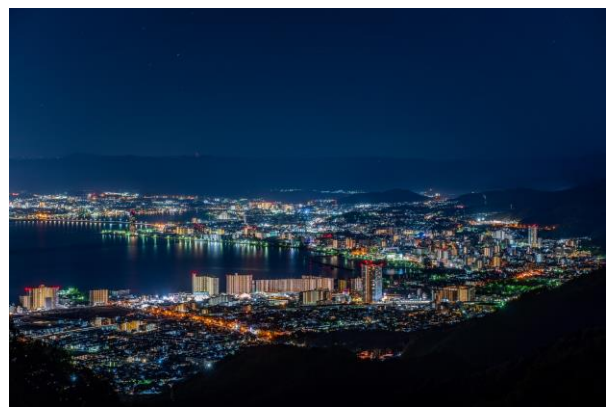
▲比叡山からの眺め(大津市街地方面)