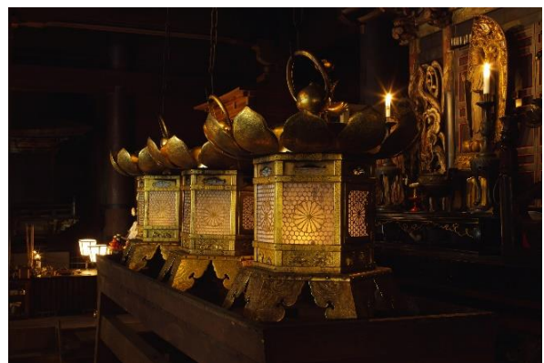
▲根本中堂 (不滅の法灯)