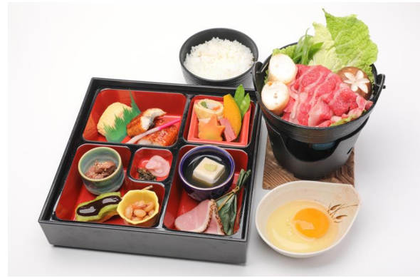
▲峰道レストラン&展望台でのお食事