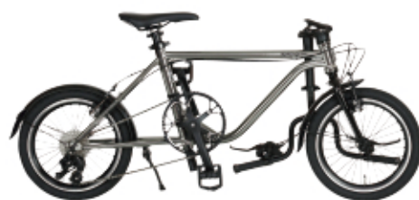
折りたたみイメージ