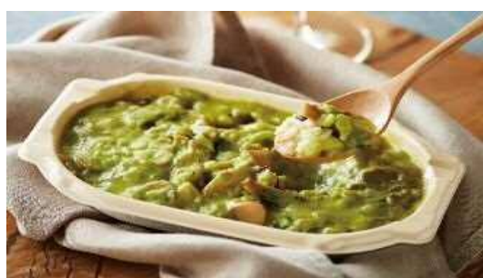
4種きのこと牡蠣のリゾット 240g 1,100円（税込1,188円）