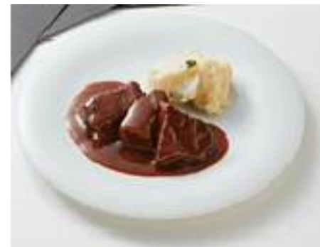
牛ほほ肉の赤ワイン煮込み ポテトピュレ添え 220g 1,800円（税込1,944円）