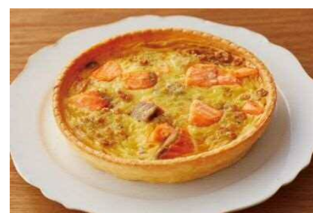
ゴルゴンゾーラ香るサーモントラウトのキッシュ 165g 1,100円（税込1,188円）