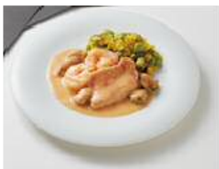
金目鯛と海老のマリニエール サフランライス添え 200g 1,600円（税込1,728円）