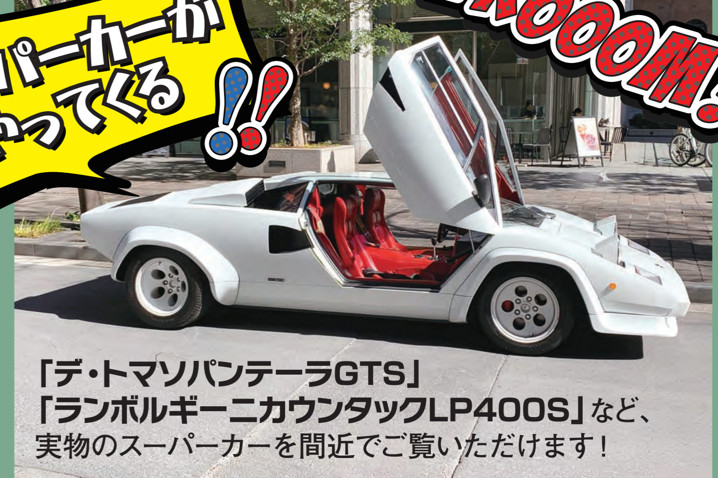
「デ・トマソパンテラGTS」 「ランボルギーニカウンタックLP400S」など、 実物のスーパーカーを間近でご覧いただけます!