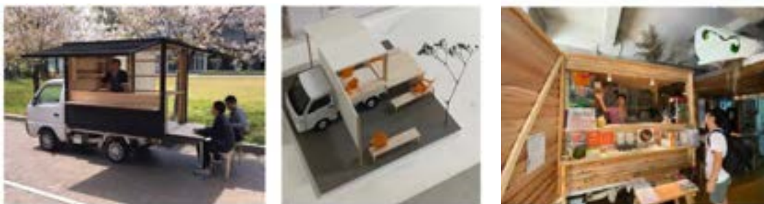
mozo Food Marchéへ設置予定のキッチンワゴン（イメージ）

また、名古屋芸術大学との産学連携の一環として、「フロアマップ」「アートウォール」「キッチンワゴンカー」を建築インテリア系コースの学生により製作しました。今後、「キッチンワゴンカー」を使った期間限定のPOP UP ショップも展開予定です。壁面には同大学の学生達の作品を展示したり、将来的にはmozo Food Marchéを産学連携のワークショップの場としても使えるようにする予定です。