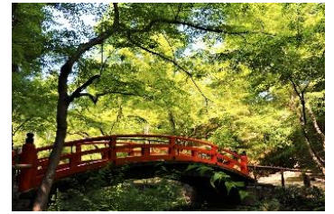
北野天満宮 もみじ苑

北野天満宮は菅原道真公を御祭神としておまつりする全国約1万2000社の天満宮、天神社の総本社です。平安時代中頃に、多治比文子(たじひのあやこ)や近江国(滋賀県)比良宮の神主神良種(みわのよしたね)、北野朝日寺の僧最珍らが当所に神殿を建て、菅原道真公をおまつりしたのが始まりとされます。