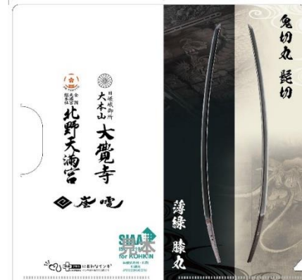
オリジナルチケットケース