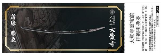
大覚寺霊宝館 拝観引換券