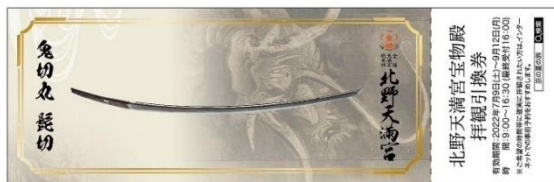
北野天満宮宝物殿 拝観引換券

近年、北野天満宮の太刀鬼切丸(髭切)と大覚寺の太刀薄緑(膝丸)が源氏の兄弟刀として注目を集め、両社寺ではこれまでも2回、特別展を同時公開しています。今回第三弾となる公開に合わせて、観光のお客さまはもちろん、近隣の皆さまも公共交通機関である電車とバス、自転車を乗り継いで目的地へ移動していただける企画券です。