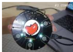
残りのHPがわかるデバイス