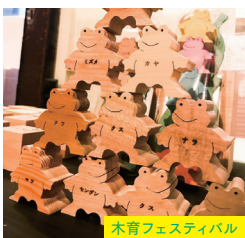
木育フェスティバル