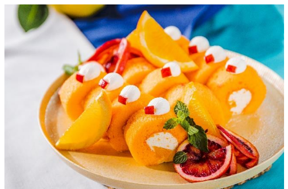
オレンジのロールケーキ