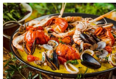
オマール海老と新鮮魚介のパエリア