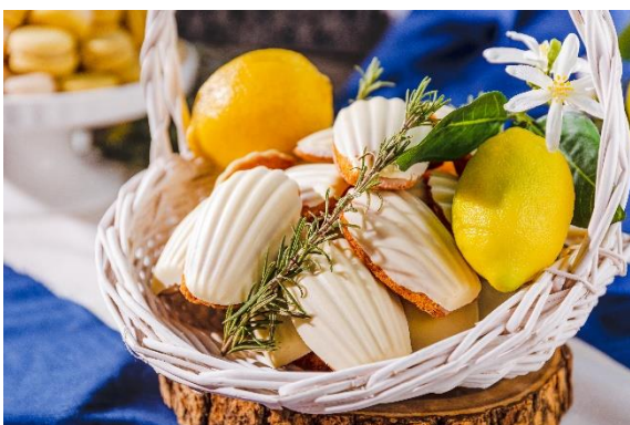
レモンのマドレーヌ