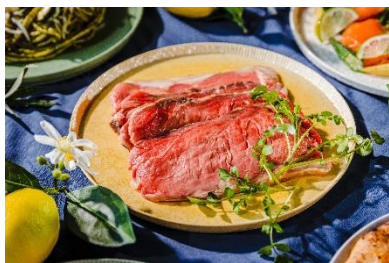
肉厚なローストビーフ

大丸東京最上階から望む景色を間近に見ながら、優雅な時間を過ごさせてくれるXEX TOKYOのランチbuffet。約50種類以上あるbuffetではこの夏限定の「羊肉のサルシッチャと夏野菜のピッツァ」や自家製の「スパイスチキンカレー」など、一度食べたらやみつきになる料理ばかり。更にはXEX TOKYO限定で大人気のローストビーフに加え、ローストポークも合わせてご用意いたしました。スパイスな料理やお肉を食べてパワーチャージ！