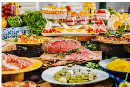
東京駅舎を一望できるランチbuffet

大丸東京最上階から望む景色を間近に見ながら、優雅な時間を過ごさせてくれるXEX TOKYOのランチbuffet。約50種類以上あるbuffetではこの夏限定の「羊肉のサルシッチャと夏野菜のピッツァ」や自家製の「スパイスチキンカレー」など、一度食べたらやみつきになる料理ばかり。更にはXEX TOKYO限定で大人気のローストビーフに加え、ローストポークも合わせてご用意いたしました。スパイスな料理やお肉を食べてパワーチャージ！