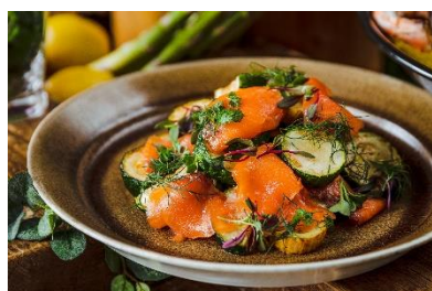
サーモンとズッキーニのマリネ

エレベーターを降りてすぐのワンフロア約900㎡を独占し、天井高も3m以上と広々とした空間の中で過ごすことのできる開放感が魅力の「XEX 日本橋」。広々とした自慢のオープンキッチンにずらっと並ぶ華やかな料理の数々は五感で愉しませてくれます。魚介がたっぷりに入った「オマール海老と新鮮魚介のパエリア」や「和牛すじ肉とハチノスのランブレドット」など新メニューが登場！この夏にしか味わうことのできない料理の数々をご堪能ください。