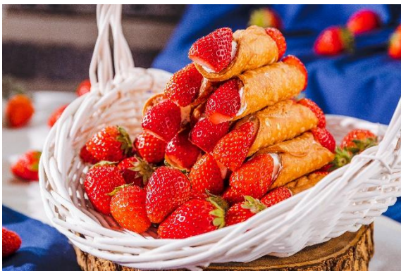
カンノーリ リコッタ苺クリーム