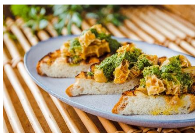
和牛すじ肉とハチノスのランブレドット