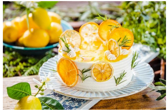
レモンショートケーキ