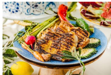
厳選鶏と夏野菜のスパイスグリル

【 XEX ATAGO GREEN HILLS 】 所在地: 〒105-6242 東京都港区愛宕2-5-1 MORIタワー42F 電話番号: 03-5777-0065 / ランチタイム: 11:30~15:00 (最終入店 14:00) 5,800円(税込サ別) ※90分制となります