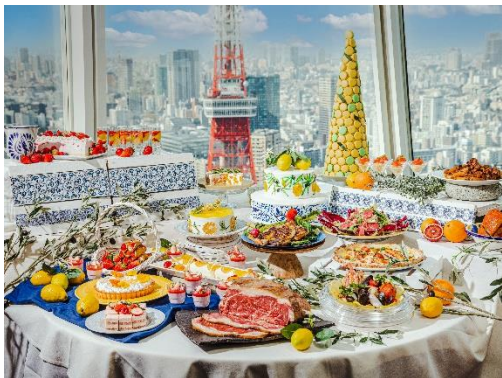
絶景と愉しむランチbuffet

エントランスを抜けて店内へ入ると、ビルの42階の絶景が出迎えてくれるXEX ATAGO GREEN HILLS。圧巻の景色を眺めながらランチbuffetを愉しめるのが自慢なレストランです。今回のbuffetには夏野菜やシトラスフルーツをふんだんに使用し、見た目も鮮やかにご用意いたしました。華やかに仕上げた「和牛のグリルとトレビス、ルッコラのバルサミコサラダ」やジューシーな「厳選鶏と夏野菜のスパイスグリル」など。そして何と言っても、大人気のローストビーフには和牛を使用！数々の自慢な料理を是非、ご堪能ください。