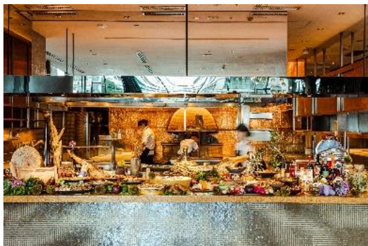
オープンキッチンから出来立ての料理を

エレベーターを降りてすぐのワンフロア約900㎡を独占し、天井高も3m以上と広々とした空間の中で過ごすことのできる開放感が魅力の「XEX 日本橋」。広々とした自慢のオープンキッチンにずらっと並ぶ華やかな料理の数々は五感で愉しませてくれます。魚介がたっぷりに入った「オマール海老と新鮮魚介のパエリア」や「和牛すじ肉とハチノスのランブレドット」など新メニューが登場！この夏にしか味わうことのできない料理の数々をご堪能ください。