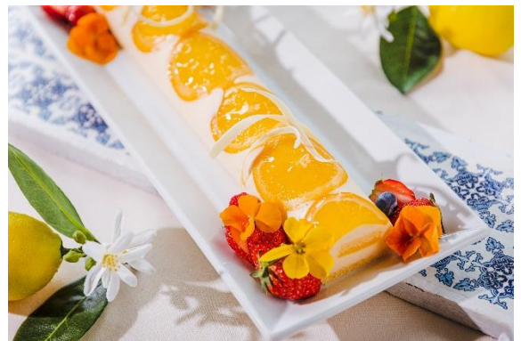
オレンジとシトラスのレアチーズムース