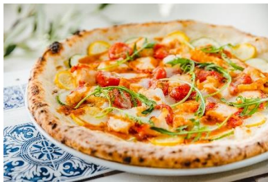
オマール海老と彩り旬菜のピッツァ