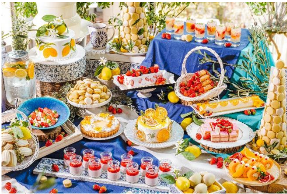
XEX SUMMER ブッフェ