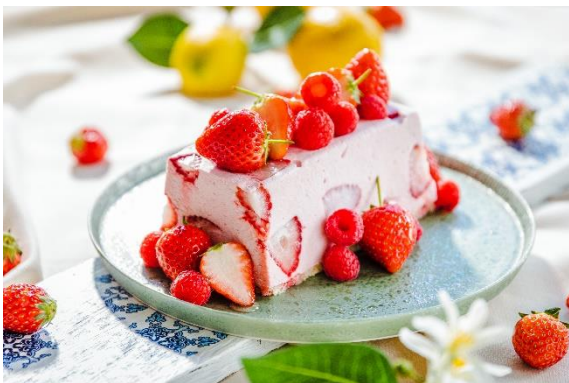
苺のカッサータムース