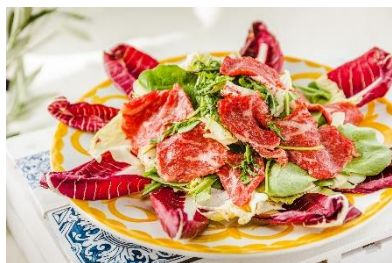
和牛のグリルとトレビス、ルッコラのバルサミコサラダ

エントランスを抜けて店内へ入ると、ビルの42階の絶景が出迎えてくれるXEX ATAGO GREEN HILLS。圧巻の景色を眺めながらランチbuffetを愉しめるのが自慢なレストランです。今回のbuffetには夏野菜やシトラスフルーツをふんだんに使用し、見た目も鮮やかにご用意いたしました。華やかに仕上げた「和牛のグリルとトレビス、ルッコラのバルサミコサラダ」やジューシーな「厳選鶏と夏野菜のスパイスグリル」など。そして何と言っても、大人気のローストビーフには和牛を使用！数々の自慢な料理を是非、ご堪能ください。