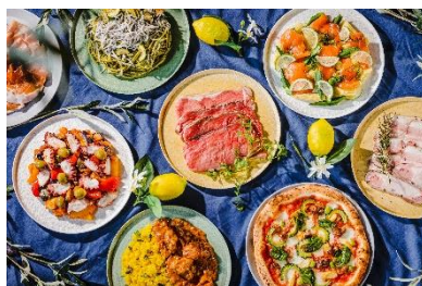
スパイス料理等愉しめるSUMMER buffet