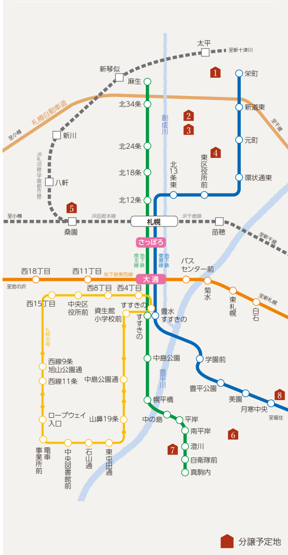
ROSE GRANDE 澄川1条