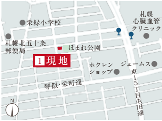
ROSE GRANDE 北49東14

地元札幌の施工会社様とタッグを組み、 都市生活や今の時代に求められる 商品企画により、 建売住宅の枠を超えた住まいを 札幌エリアで広く提供していきます。