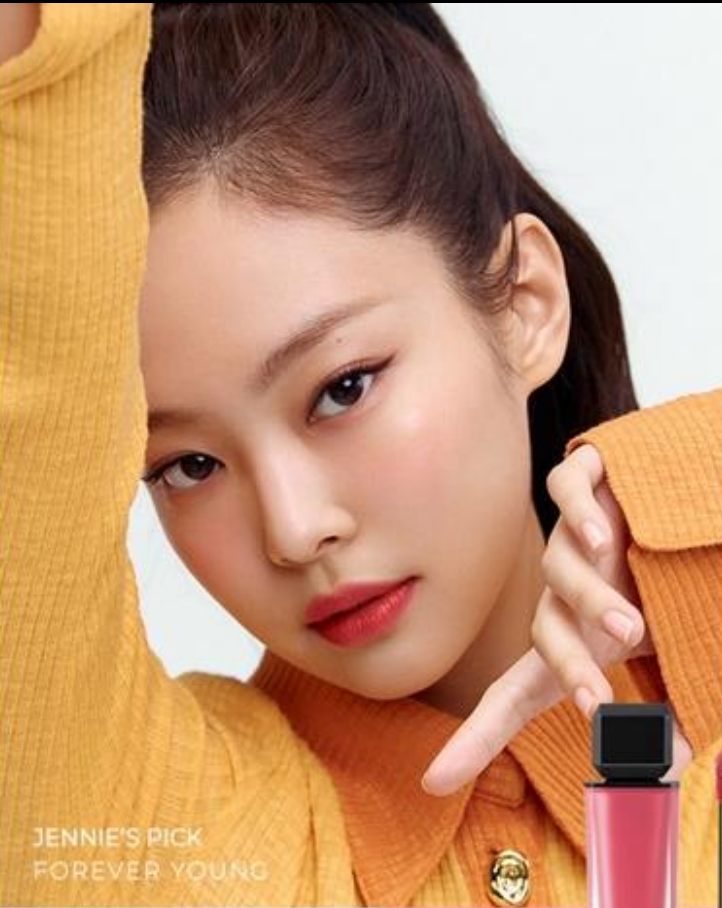
JENNIE'S PICK FOREVER YOUNG