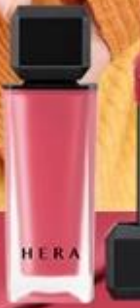
#145 フォーエバー ヤング