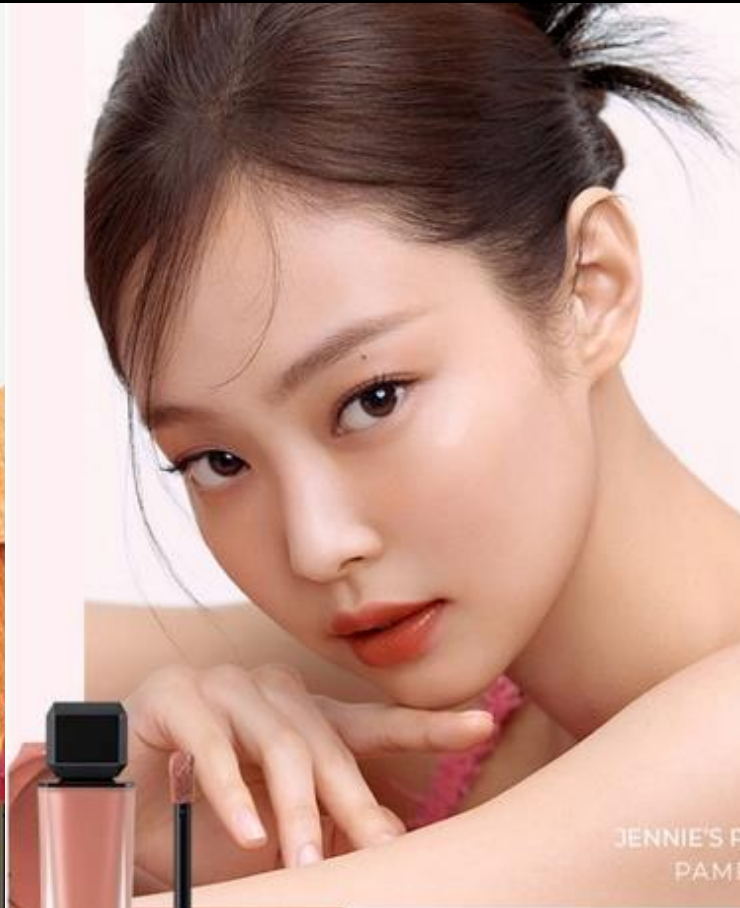
JENNIE'S PICK BANPAS