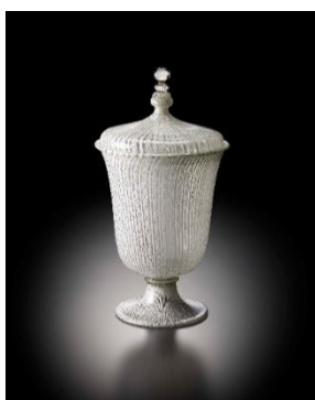
レース・ガラス蓋付ゴブレット 16世紀末～17世紀初