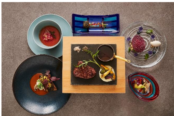
ガラスの森美術館タイアップ 特別ディナー

「リバーサイドキッチン&バー」の薪グリル料理は、フレッシュな木の香り、スモーキな風味が欠かせず、火加減、薪の種類、水分量、食材と火の距離感のバランスを知り尽くされたお料理です。地魚のグリルや幻のお肉ともいわれる相州牛のランプステーキのメイン料理で絶妙な焼き加減をご堪能ください。