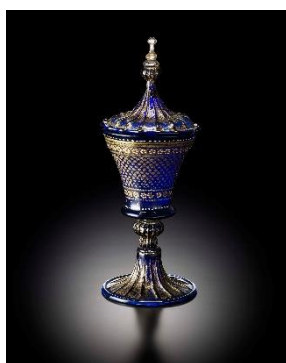
点彩花文蓋付ゴブレット 1500年頃

プランに含まれる学芸員特別解説ツアーは、15世紀から19世紀までのヴェネチアン・ガラスの歴史や作品の見どころなどのご紹介に加えて、20世紀のガラス彫刻作品を展示した「現代ガラス美術館」までをご案内する当プラン特別のツアー内容です。ヴェネチアが培ってきたガラス制作技術、そして現代に受け継がれてきたストーリーの理解を深めることができます。ツアーの最後には、品揃え豊かなミュージアムショップ内にて長きにわたり継承されてきた伝統技術のお話や作家の思いもご紹介します。ルネサンス時代から現在までと数百年の歴史と合わせて様々な作品を鑑賞することで、時を経ても輝きを放ち続けるヴェネチアン・ガラスの雄大なストーリーに出会い、ヴェネチアを体感してください。