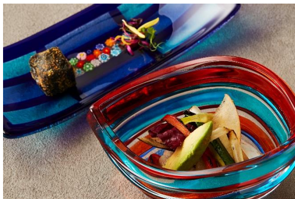
(上)「クロメスキ」 (下)「低温調理した鴨コンフィと薪のグリル野菜 コリアンダーシード入りソース」

お泊りいただく客室は、個性的で箱根の自然と文化にインスパイアされた世界にふたつとないインテリアデザインのモダンなお部屋です。全室プライベート温泉付きで好きな時好きなだけ天然温泉でリフレッシュいただけます。ホテル内の至るところに箱根らしさを感じることができ、広い箱根を庭のように楽しみ尽くせるロケーションも魅力です。ホテルインディゴ箱根強羅では、自分を取り戻すことができる隠れ家のようにところとからだをリチャージする、ワンランク上の滞在を体験いただけます。