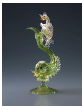
龍装飾ドルフィン形水差 19世紀