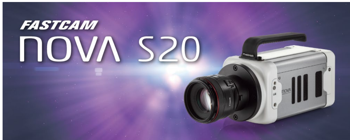
FASTCAM Nova S20