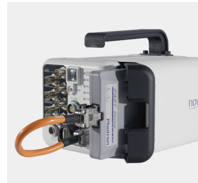
FAST Drive 装着

専用 SSD の FAST Drive 4TB 対応で超高速データ保存が可能です。従来比 ※1 約 10 倍のデータ転送速度により 10 分の待ち時間を 1 分に短縮できるので、高速撮影にかかる作業が効率的に行えます。