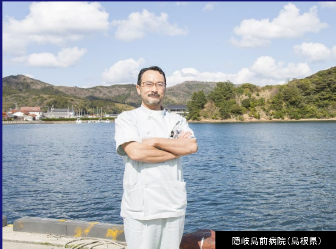
隠岐島前病院(島根県)