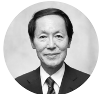
永井 良三 自治医科大学 学長

1974年 東京大学医学部卒業。医学博士。1983年 米国ハーモント大学留学。2003年 東京大学医学部附属病院病院長。2012年より現職。2019年より宮内庁皇室医務主管。ヘルツ賞、日本医師会医学賞など多数受賞。