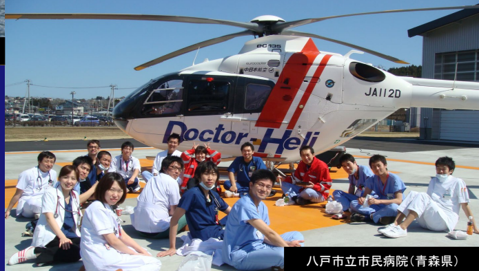
八戸市立市民病院(青森県)