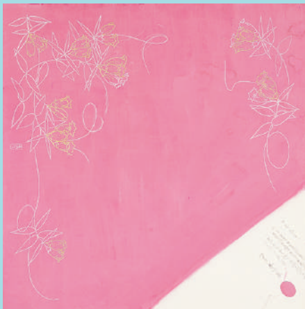
望月春江 りんどう 1963年(昭和38)頃