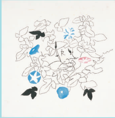
堂本印象 夏 朝顔 1952年(昭和27)