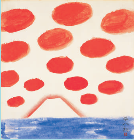
福田平八郎 富士山 1964年(昭和39)