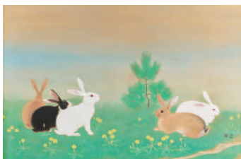
堂本印象 兎春野に遊ぶ 1938年(昭和13)