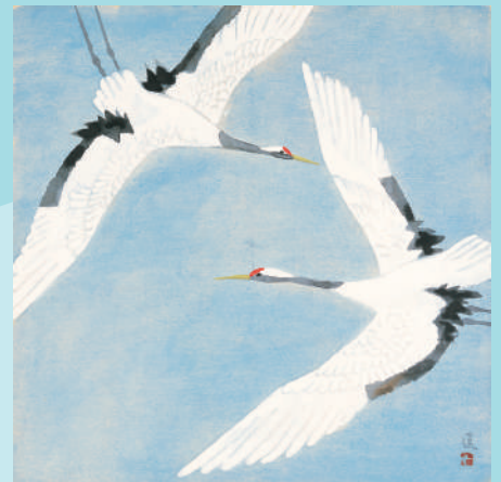
池田蓬邨 双鶴 1965年(昭和40)頃