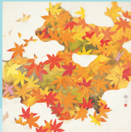
加藤栄三 紅葉 1954年(昭和29)頃