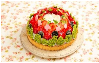
【ラ・メゾン アンソレイユターブル パティスリー】 さくらとあまおうのタルト 1ピース 860円

この春6周年を迎えた大名古屋ビルディング。周年の感謝を込めて、“SAKURA”をイメージした桜グルメやピンクアイテムが登場。今しかない限定アイテムもご用意します。