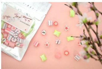
【ババブレ】 さくらミックス 袋 640円、S瓶 910円、M瓶 2,530円