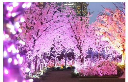
5Fサクラスカイガーデン夜景