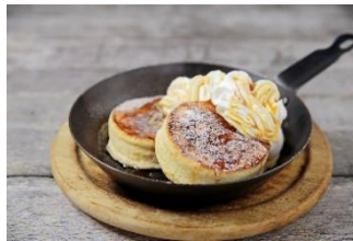
【YURT】 塩メープルと北海道産発酵バターの スフレパンケーキ 666円