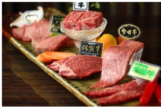
【肉や大善】 6周年限定 銘柄和牛盛り合わせ 2人前 19,800円

開業6周年にちなんで、666円・6食限定・6種盛りをはじめ、今だけの6周年特別価格やスペシャルメニューが登場します。