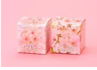
【annon tea house】 キューブボックス「さくら色のパステル」 「花のさくら通り」 各2.5g×11包 777円