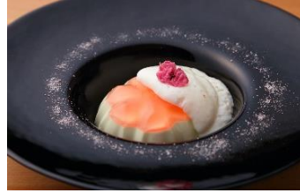
【TRATTORIA FRATELLI GALLURA】 桜のバナナコッタとミルクのエスプーマ 桜塩のアクセント 1,000円