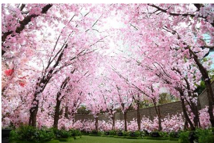
5Fサクラスカイガーデン