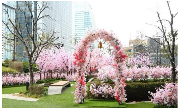
5Fサクラスカイガーデン

都会でお花見！6周年の感謝を込めて、春を感じる桜でいっぱい華やかなスカイガーデンをご用意。 夜は、ピンク×ホワイトイルミネーションが輝きます。