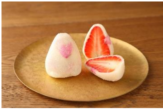
【寛王山フルーツ大福 弁才天】 フルーツ大福 桜いちご 600円～