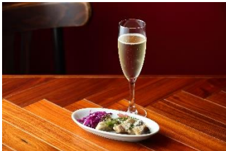
【ローマ三丁目】 6周年セット 666円 デイナーのみ