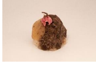
【OHAGI3】 桜月-SAKURAZUKI- 1個 200円