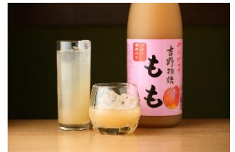
【リアル grand】 やたがらす 吉野物語 もも 1杯 666円

※店舗商品・メニューは、予告なく変更となる場合があります。 ご取材・ご掲載の際は、PR事務局までお問合せください。※価格は税込です。