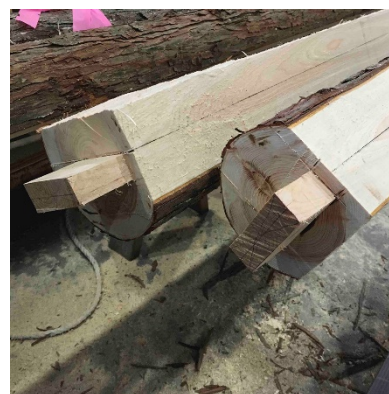
<丸太の梁イメージ>