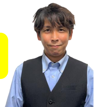
※観光ガイド（イメージ）