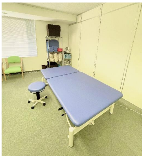
リハビリルーム(イメージ)