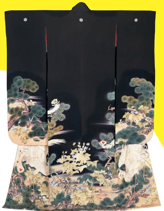
松桐鳳凰文様振袖 三つ襲ねのうち(堂本印象下絵) 大正時代 北村美術館蔵