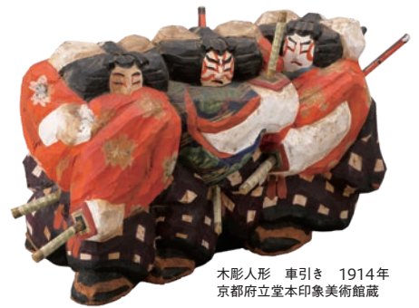
木影人形 車引き 1914年 京都府立堂本印象美術館蔵