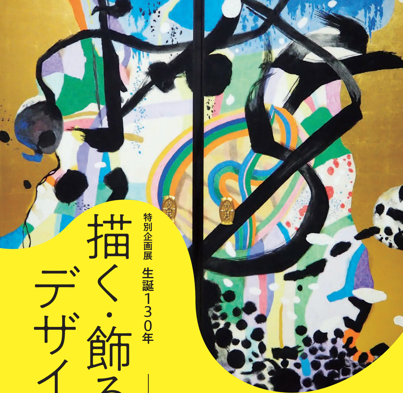
上：超ゆる空(部分) 1968年 岐阜・瑞甲山乙津寺蔵 下：木彫人形 月影 1914年 京都府立堂本印象美術館蔵