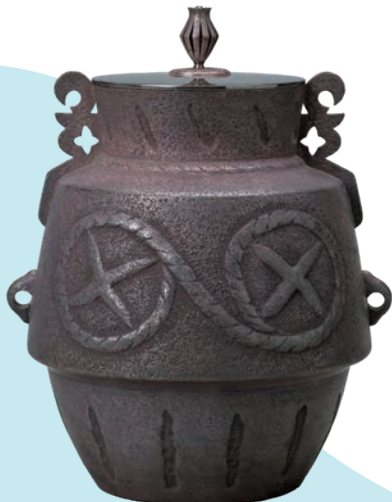
茶釜 地中海(堂本印象下絵) 1963年 京都府立堂本印象美術館蔵