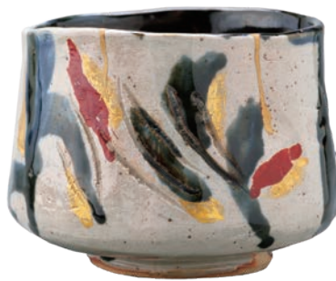
茶碗 高風想思 1970年 京都府立堂本印象美術館蔵