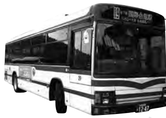
※特急大原女号 ラッピング前の 車両となります。