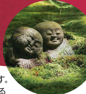
三千院 わらべ地藏 (イメージ) 作: 杉村孝

今年100周年を迎える京都バスが、この冬「大原女」のラッピングバスの特急運行をします。「大原女号」との写真撮影会や、京都バス限定グッズの販売、大原の魅力的な事業者によるマルシェも実施します。みなさん是非おこしください。