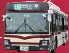
※特急大原女号(ラッピング前の車両となります。)