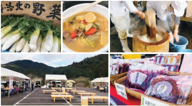
写真は全てイメージです。

今年100周年を迎える京都バスが、この冬「大原女」のラッピングバスの特急運行をします。「大原女号」との写真撮影会や、京都バス限定グッズの販売、大原の魅力的な事業者によるマルシェも実施します。みなさん是非おこしください。