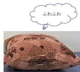
座席シートモケットクッション