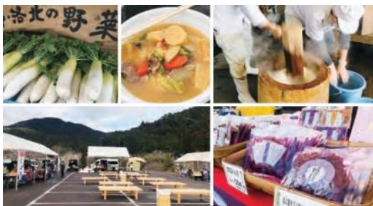
マルシェ(イメージ)