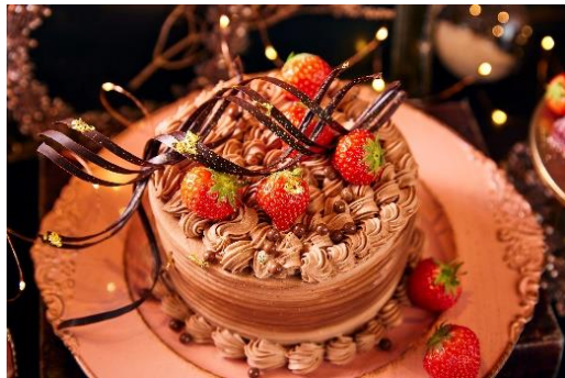
いちごのチョコレートケーキ