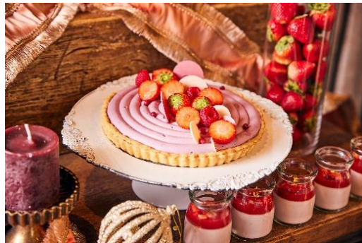
ルビーチョコレートタルト