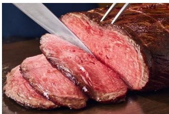
人気！ローストビーフ

大人気のローストビーフを始めとしたbuffetの数々をご用意。トリュフをふんだんに使用した「トリュフ香る特選鶏のフリカッセ」や「トリュフとキノコのピッツァ」。これからの季節にぴったりな体の芯から温まる「洋風おでん」など、「冬」を愉しませてくれる料理が目白押し。ボリューム溢れるbuffetを愉しめるのはXEX ATAGO GREEN HILLSだからこそ！目の前にそびえ立つ東京タワーと絶景を一緒にお楽しみください。