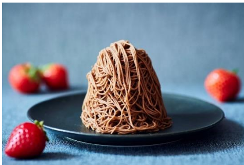
いちごチョコモンブラン