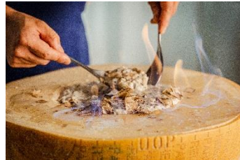
香り高い黒トリュフリゾット

【 XEX 日本橋 】 所在地: 〒103-0022 東京都中央区日本橋室町2丁目4-3 YUITO/日本橋室町野村ビル4F 電話番号: 03-3548-0065 / ランチタイム: 11:30~15:30 (L.O. 14:00) 3,480円(税込サ込) ※90分制となります