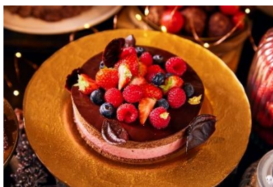
苺とクーベルチュールチョコレートのムース