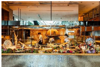
LIVE感溢れるオープンキッチン