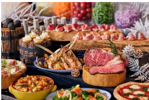
旬の食材を使用したbuffetの数々

最上階からの東京駅舎を一望しながら楽しむXEX TOKYOでのランチは格別。キッチンに広がる旬の食材を使用したbuffetの数々は絶品です。たっぷりと具材を使用した「海老・蟹チーズドリア」やふわっとした食感とトリュフの香りがたまらない「トリュフスクランブルエッグ」。XEX TOKYOのランチbuffetには欠かせず人気のカレーシリーズはピリッと辛い「ホワイトカレー」をご用意いたしました。