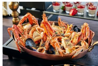
イチオシ！ズッパディペッシェ

【 XEX ATAGO GREEN HILLS 】 所在地: 〒105-6242 東京都港区愛宕2-5-1 MORIタワー42F 電話番号: 03-5777-0065 / ランチタイム: 11:30~15:00 (最終入店14:00) 4,800円(税込サ別) ※90分制となります