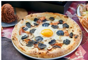
トリュフ香るキノコのピッツァ