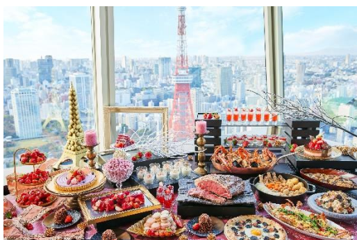
42階からのパノラマとお楽しみいただけるランチ

大人気のローストビーフを始めとしたbuffetの数々をご用意。トリュフをふんだんに使用した「トリュフ香る特選鶏のフリカッセ」や「トリュフとキノコのピッツァ」。これからの季節にぴったりな体の芯から温まる「洋風おでん」など、「冬」を愉しませてくれる料理が目白押し。ボリューム溢れるbuffetを愉しめるのはXEX ATAGO GREEN HILLSだからこそ！目の前にそびえ立つ東京タワーと絶景を一緒にお楽しみください。