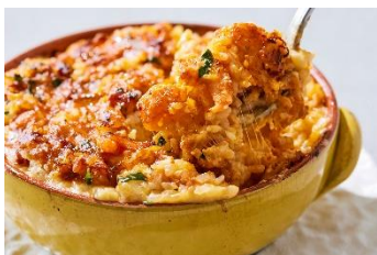
具材たっぷり海老・蟹チーズドリア

最上階からの東京駅舎を一望しながら楽しむXEX TOKYOでのランチは格別。キッチンに広がる旬の食材を使用したbuffetの数々は絶品です。たっぷりと具材を使用した「海老・蟹チーズドリア」やふわっとした食感とトリュフの香りがたまらない「トリュフスクランブルエッグ」。XEX TOKYOのランチbuffetには欠かせず人気のカレーシリーズはピリッと辛い「ホワイトカレー」をご用意いたしました。