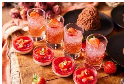
いちごのゼリーとパンナコッタ