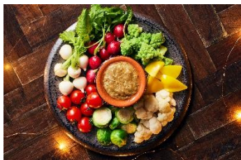
カニ味噌香るバーニャカウダ

シェフが目の前で調理するライブキッチンを間近で見ながら愉しめる、XEX日本橋のランチbuffet。目にも鮮やかなbuffetがずらっと並び、食欲をそそります。新鮮な野菜と香りを愉しむ「カニ味噌香るバーニャカウダ」や香り高いグラナパダーノと黒トリュフを和えた「黒トリュフリゾット」など、見た目・香り・味など五感でお愉しみいただけるbuffetの数々をご用意いたしました。