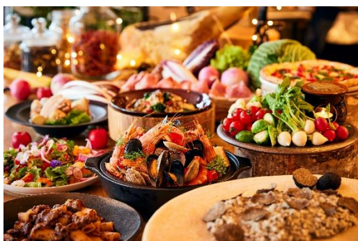
目にも鮮やかなbuffetの数々

シェフが目の前で調理するライブキッチンを間近で見ながら愉しめる、XEX日本橋のランチbuffet。目にも鮮やかなbuffetがずらっと並び、食欲をそそります。新鮮な野菜と香りを愉しむ「カニ味噌香るバーニャカウダ」や香り高いグラナパダーノと黒トリュフを和えた「黒トリュフリゾット」など、見た目・香り・味など五感でお愉しみいただけるbuffetの数々をご用意いたしました。