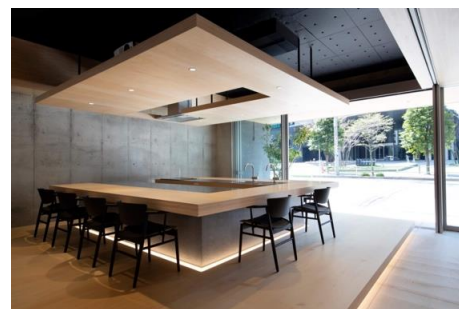
「BIRTH DINING by plein」

不動産業界で「食堂＝ダイニング」は、独立した食事をする部屋でしたが、最近はキッチンと一体化したダイニング・キッチンや、リビングと一体化してリビング・ダイニングとなっています。飲食業界では、「食堂」は古くから気軽に飲食できる場として支持を得ていましたが、時代の流れとともに少なくなっています。「BIRTH DINING by plein」は、できる限り「人が集まって食事をする楽しさ」を重視し、今の時代に合う「食を通じたコミュニケーションの場」を提供し、ぬくもりのある街づくりに貢献してまいります。