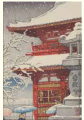
川瀬巴水「雪の寺」(前期)