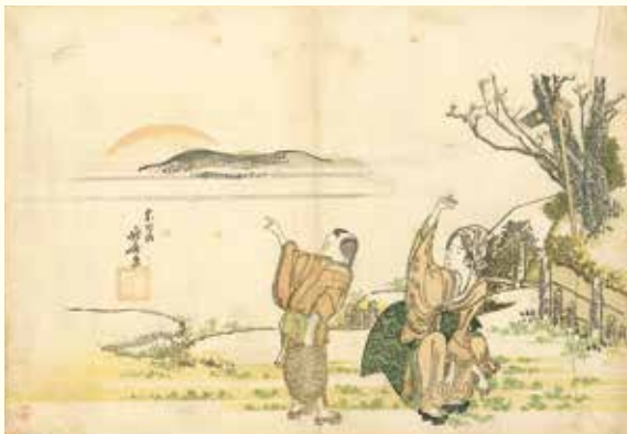
葛飾北斎「初若菜」(前期)

当館では、北斎の研究者であり、世界有数の北斎作品コレクターであったピーター・モース氏と、葛飾派作品以外にも貴重で多種多様な資料を収集した浮世絵研究の第一人者・榎崎宗重氏の二大コレクションを有しています。本展ではピーター・モースコレクションより江戸時代の風俗・流行が窺える作品、榎崎宗重コレクションより江戸から昭和期にかけて特に人気や評価が高かったとされる絵師・画家の作品を厳選し、約140点を展観します。希少な北斎作品や、高名な絵師・画家たちによる貴重な作品の数々を展示し、両氏が生涯をかけて収集、研究した珠玉の名品に対するこだわりと研究業績を紹介します。