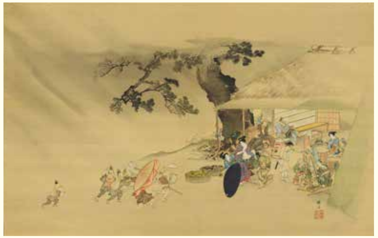
蹄齋北馬「夕立図」(前期)