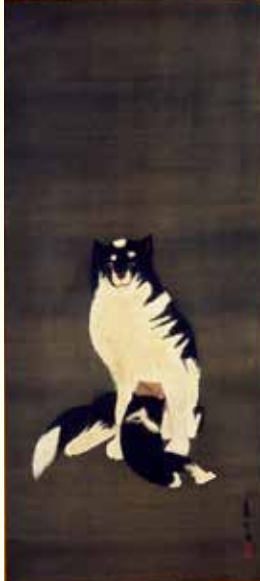
長沢蘆雪「洋風母子犬図」(後期)