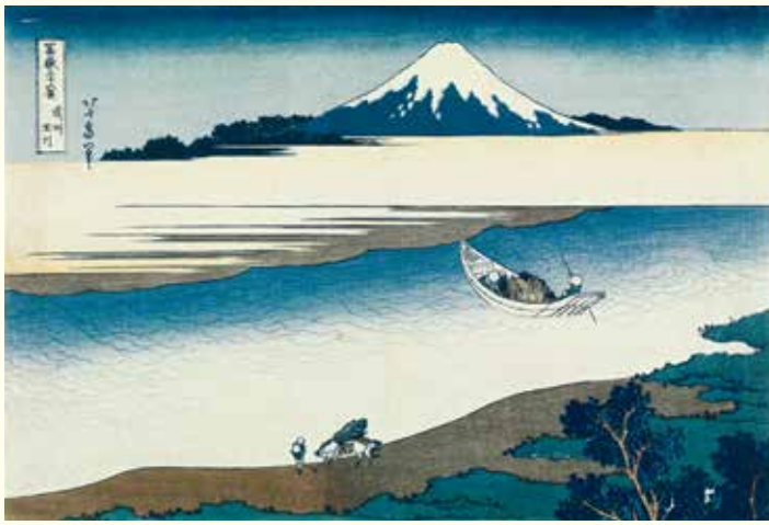
葛飾北斎「富嶽三十六景 武州玉川」(前期)