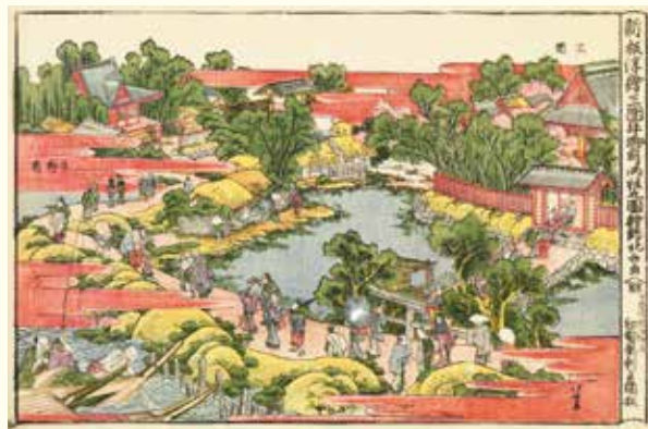
葛飾北斎「新板浮絵三田牛御前両社之図」(後期)