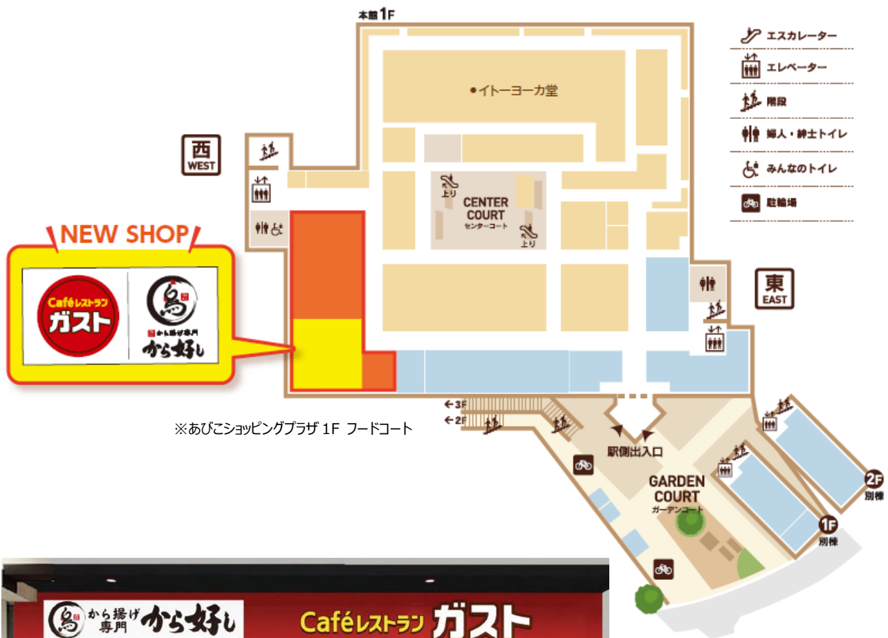
※あびこショッピングプラザ 1F フードコート