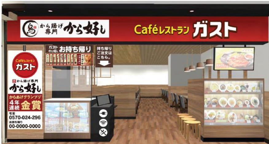
※ガスト・から好し イメージパース

お客様のご要望にお応えして、お子様から大人まで幅広い年代層が喜んでいただけるレストランの誘致を行った結果、ファミリーレストランの「ガスト」の開業が実現いたしました。